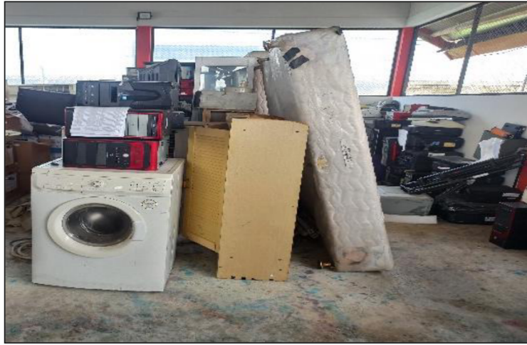
FOTO OBYEK LELANG